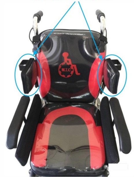
نگهدارنده های بغل پهلویی