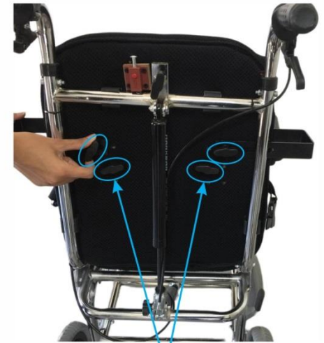
گل پیچ های مشکی رنگ

۵. برای نصب نگهدارنده ها پهلوی گل پیچ های مشکی رنگ پشت تکیه گاه ویلچر را باز کرده و نگهدارنده بغل پهلویی را از بین لوله و پشتی رد کنید. اندازه را نسبت به عرض بدن بیمار مشخص کرده و با محکم کردن پیچ ها نگهدارنده پهلوی ها را در جای خود ثابت کنید.